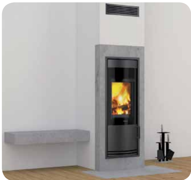
Schiedel KINGFIRE® RONDO S con rivestimento ceramico fuori spessore finitura BETON cls effetto grezzo a vista. Con pedana frontale ceramica abbinata.