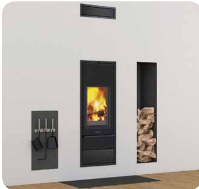
Schiedel KINGFIRE® LINEARE S senza rivestimento, con pedana frontale in ceramica finitura NERO.