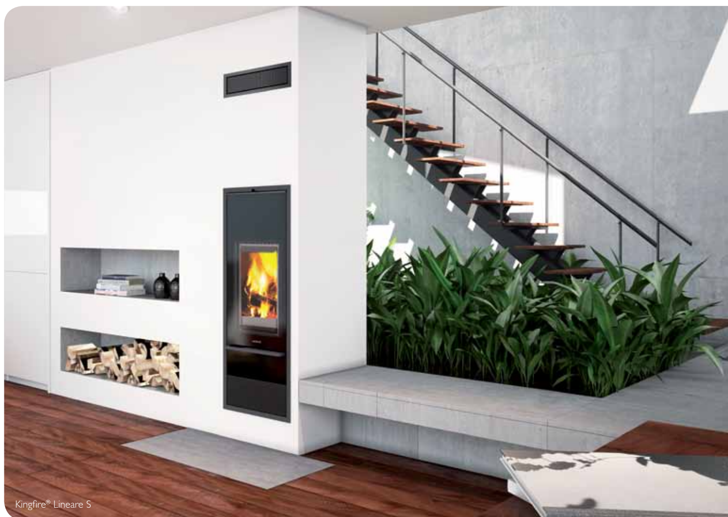
Kingfire® Lineare S