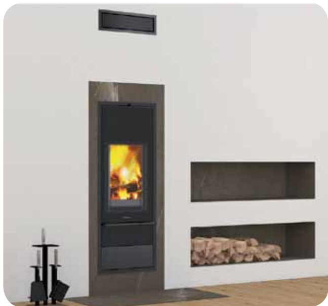
Schiedel KINGFIRE® LINEARE S con rivestimento ceramico a parete finitura PULPIS base in tono marrone tabacco e sottili venature bianche e dorate che solcano la lastra. Con pedana frontale ceramica abbinata.

per i modelli Schiedel KINGFIRE® LINEARE S e RONDO S