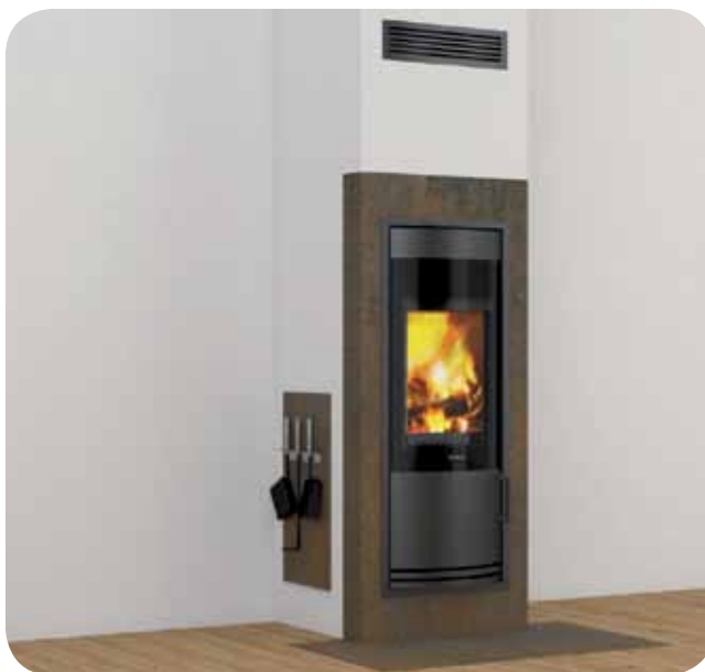
Schiedel KINGFIRE® RONDO S con rivestimento ceramico fuori spessore finitura acciaio effetto ruggine CORTEN. Con pedana frontale ceramica abbinata.

SCHIEDEL SRL STABILIMENTI E MAGAZZINI Via Montegrappa, 19 - 20060 Truccazzano (MI) - Tel. +39 02 950731 - Fax +39 02 9583287 info@schiedel.it