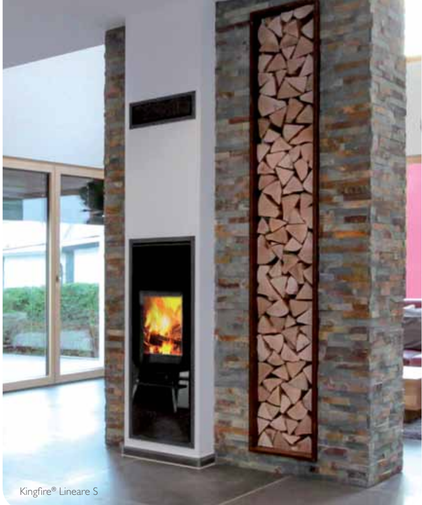
Kingfire® Lineare S

DESIGN A SCOMPARSA INGOMBRI MINIMI ALTA EFFICIENZA ENERGETICA